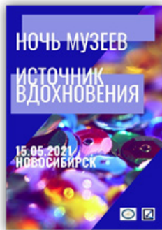
Рис. 4. Акция Института искусств как результат реализации социально значимого творческого проекта «Ночь музеев» (2021 г.)

Особенностью реализации такого социально значимого проекта всероссийского уровня, как культурная акция «Ночь музеев», стала организация на базе Института искусств традиционных интерактивных выставок (рис. 4).