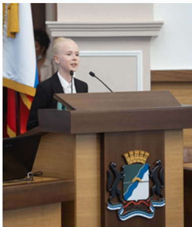
Рис. 2. Выступление с докладом, посвященным реализации проекта «Подарок мэра первоклассникам. Азбука Новосибирска для детей и взрослых»

Особенностями реализации такого социально-значимого проекта городского и областного уровня, как просветительские экскурсии для школьников г. Новосибирска «С искусством по дорогам детства», стали разработка школьниками уникальных увлекательных экскурсионных маршрутов по Институту искусств, а также их проведение для других школьников города Новосибирска. Здание института наполнено авторскими работами, школьникам было предложено сопроводить их историями.