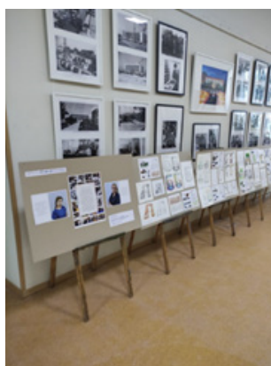
Рис. 7. Фрагмент организованной выставки в рамках международного фестиваля «Книжная Сибирь» в ГПНТБ СО РАН

печатной продукции. Мало хорошо рисовать, надо уметь разговаривать с писателем или поэтом, редактором и другими участниками издательского процесса. Но первое – надо, чтобы тебя увидели (рис. 7).