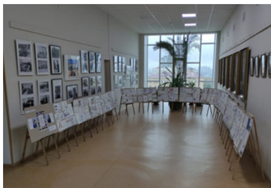
Рис. 6. Выставка в рамках международного фестиваля «Книжная Сибирь»

организация на базе библиотеки выставки иллюстраций обучающихся ДАХТиД (рис. 6).