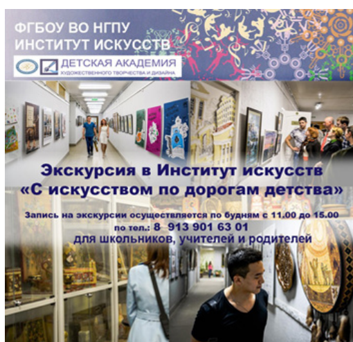
Рис. 3. Просветительские экскурсии для школьников г. Новосибирска как результат реализации социально значимого творческого проекта «С искусством по дорогам детства»

Знакомство с видами и жанрами изобразительного искусства соединилось с ключевыми заданиями квеста и превратило обычную экскурсию в увлекательное приключение. Особое значение здесь приобретают возможность делиться информацией с незнакомыми людьми, не бояться аудитории, что важно для будущих педагогов, и чувство уверенности, когда обучающиеся ведут других школьников по институту, где они уже хорошо ориентируются, много знают о процессах, проходящих в вузе (рис. 3).