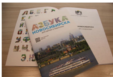
Рис. 1. «Азбука Новосибирска для детей и взрослых» как результат реализации социально значимого творческого проекта «Подарок мэра первоклассникам»

Особенностями реализации такого социально значимого проекта городского уровня, как «Подарок мэра первоклассникам», стало изготовление творческого продукта – «Азбука Новосибирска для детей и взрослых» (рис. 1).